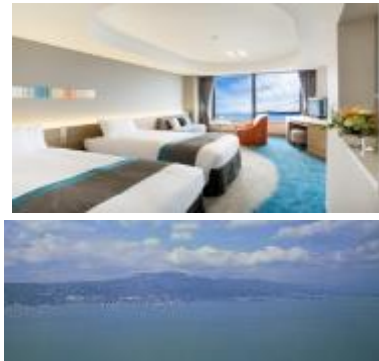
客室からの眺め 全客室レイクビュー