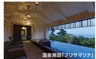
温泉施設「フリスアマリナ」