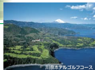
川奈ホテルゴルフコース