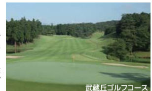
武蔵丘ゴルフコース

※2名3名1組プレーでの利用代金・広めのお部屋(27㎡)利用の追加代金・朝・夕食追加代金もございますので詳しくはお問合せください。