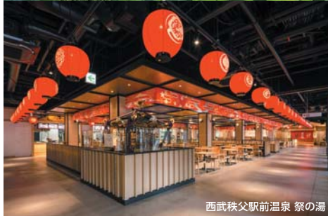
西武秩父駅前温泉 祭の湯