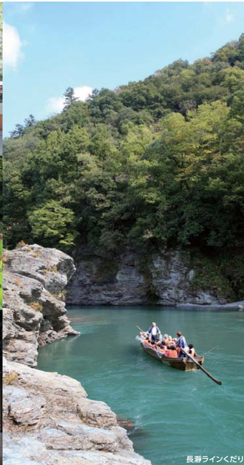
長瀬ラインくだり