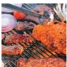
テラスバーベキューの一例