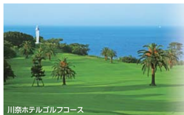
川奈ホテルゴルフコース

※2名3名1組プレーでの利用代金・海側のお部屋宿泊の追加代金・夕食追加代金もございますので詳しくはお問合せください。